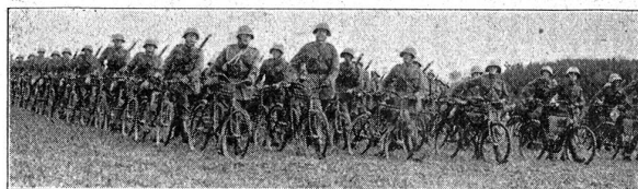
Défilé der 1. Division. — Radfahrer-Kp. 1. Défilé de la 1 re Division — Cp. de cyclistes 1.

Parce que notre démocratie doit pouvoir opposer la force à la violence, l'armée est nécessaire. Le peuple suisse aime son armée, parce que sa glorieuse histoire est liée à la conquête de nos libertés. Il estime et respecte ses soldats parce qu'ils ne feront jamais qu'une guerre défensive. D'autre part, notre patriotisme, foyer de culture, de civilisation et de progrès social, n'est point une étroitesse d'esprit opposée à l'avènement définitif de la paix universelle. L'épanouissement des grandes nations qui nous entourent ne suscitera jamais l'envie chez nous. Nous applaudissons à tous ces progrès, dont nous enrichissons notre propre culture pour la faire rayonner autour de nous. Jamais, par conséquent, notre troupe ne sera au service d'un nationalisme trop étroit. La Suisse maintiendra son armée pour assurer son indépendance