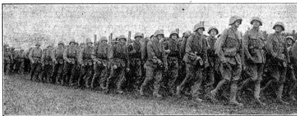
Défilé der 1. Division. — Gebirgs-Sanitätsabteilung 11. Défilé de la 1 re Division. — Groupe sanitaire de montagne 11.

« Il ne faut pas s'imaginer qu'en ce qui concerne le matériel, notre armée soit à la hauteur des exigences modernes. Nous ne sommes pas « prêts », pour employer une expression consacrée. Après 1918, nous avons vécu sur les réserves accumulées pendant la guerre que, grâce aux travaux de chômage, nous avons pu quelque peu renouveler. Mais, actuellement, pour équiper les recrues, nous devons demander des crédits spéciaux, car nos