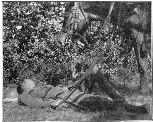
Manöver der 1. Division. — Die Kunst, den Manövern die gute Seite abzugewinnen.

J'ai eu personnellement le privilège de traverser les lignes de manœuvres le mercredi soir, à la hauteur d'Oron-la-Ville, centre des mouvements. Ce fut absolu-