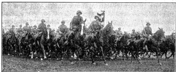
Défilé der 1. Division. — Kav.-Brigade 1. Défilé de la 1 re Division — Brigade de Cavalerie 1.

Il s'est acquitté de sa difficile mission avec tact et autorité. Peu après, le défilé il a cependant fait à l'envoyé