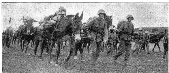
Défilé der 1. Division. — Gebirgs-Artillerie, gebastet. Défilé de la 1er Division — Batteries d'artillerie de montagne, bâties.

Le perfectionnement des armes complique chaque jour davantage la tâche des instructeurs de tous grades. Il est indispensable en effet que le soldat sache en toutes circonstances se servir au mieux de son arme. Il doit