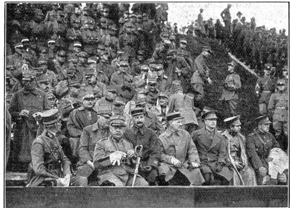
Défilé der 3. Division. — Défilé de la 3me Division.

Die fremden Offiziere. — Les officiers étrangers.