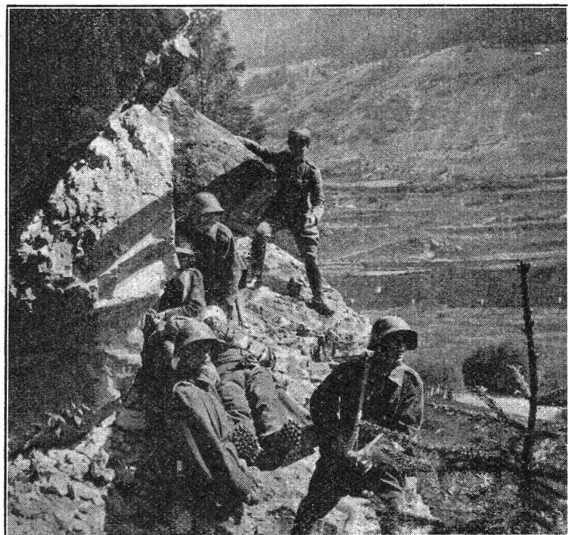
Transportübung im Fels. W. K. 1930 Tinzen. — G. I. Bat. 93, I. und II. Kp. Exercice de transport dans les rochers, C. R. 1930 à Tinzen, Bat. Inf. mont. 93, Cp. I et II.

Diensleistungen und unvernünftige Vorgesetzte ihren Lesern vor Augen zu führen, wie notwendig es sei, die Armee aufzuheben, die ihnen in der Verwirklichung ihrer Aspirationen hinderlich ist. Die Jammertante also hat es scheusslich und unverantwortlich gefunden, dass von den 87ern ein «männermörder» Marsch von Emmetten nach Altdorf verlangt wurde. Dabei ergibt sich nach unseren Erkundigungen an zuständiger Stelle, dass für diesen 22 km-Marsch mit 850 m Abstieg und