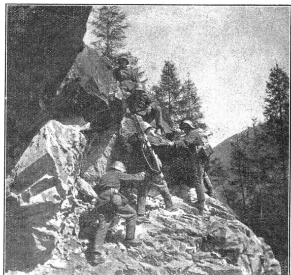
Auf der Suche nach den Verletzten. W. K. 30 Tinzen, Geb. I. Bat. 93. I. und II. Komp. A la recherche des blessés. C. R. 1930 à Tinzen, Bat. Inf. mont. 93. Cp. I et II.

In der Luzerner Arbeiterzeitung jammerte im Anschluss an den W. K. des Geb. I. Bat. 87 wieder einmal so ein «Held» in allen Tonarten über den wahnsinnig strengen Dienst. Die Redaktionen unserer roten Blätter legen ja unendlichen Wert darauf, durch Jeremiaden von Soldaten über wahrwitzige