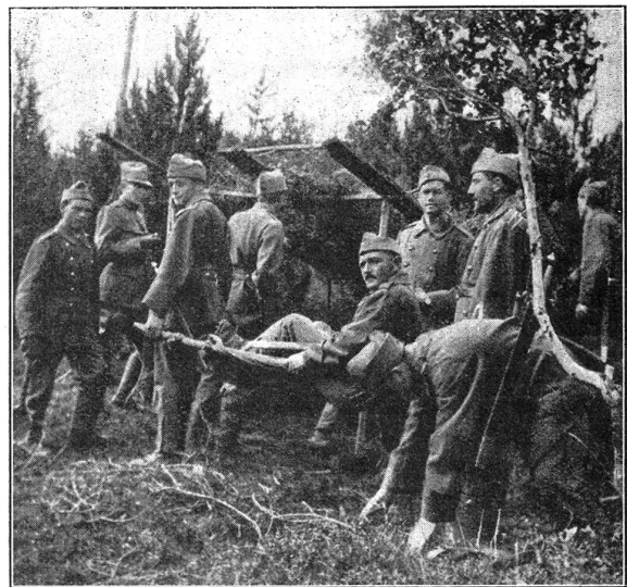
Improvisationsarbeiten. W. K. 1928. Davos. G. I. Bat. 93. Travaux improvisés. C. R. 1928 à Davos. Bat. Inf. mont. 93.

Kampf gegen den Militarismus und die Rüstungen, Kampf gegen den Kapitalismus! Auch der Kampf in Werkstätte und Fabrik für gewerkschaftliche Forderungen, der politische Kampf in Gemeinden und Staat ist ein Kampf gegen den Militarismus