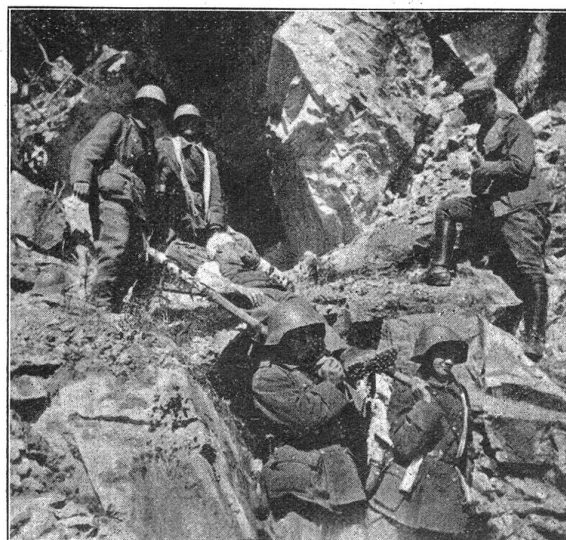
Transportübung im Fels. W. K. 1930 Tinzen. — G. I. Bat. 93, I. und II. Kp. Exercice de transport dans les rochers, C. R. 1930 à Tinzen, Bat. Inf. mont. 93, Cp. I et II.

Das Défilé in Buochs am Schluss des Gefechtes verlief auch recht gut, wenigstens hörte man nichts Gegenteiliges.