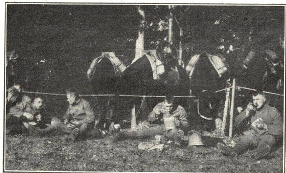
Linientrain-R.-S. Thun 1932 Wohlverdiente Ruhe- und Verpflegungsstunde für Mann und Pferd E. R. du train de ligne à Thoun en 1932 L'heure du repos et du ravitaillement est bien méritée pour hommes et chevaux