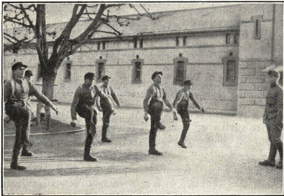
Linientrain-R.-S. Thun 1932 (Phot. Egli, Thun) Die mehr nützliche als beliebte Frühstunde wird beherrscht vom energischen Korporal E. R. du train de ligne à Thoun en 1932 La première heure de la journée, quoique utile, n'est pas toujours très goûtée; un énergique caporal dirige la gymnastique

Wir sind nicht so neugierig zu fragen, ob die Bedingungen für diese Ausleihen ebenso schwere sind, wie diejenigen, die die Unteroffiziersvereine für ihre militärischen Uebungen außer Dienst zu erfüllen haben, oder ob die Refraktäre und Deserteure, die zum Teil die Bestände dieses « Zivildienstes » bilden, einen Vorzugstarif genießen. Aber wir können unsere Entrüstung darüber nicht verschweigen, daß kürzliche Verhandlungen vor dem Divisionsgericht 5 festgestellt haben, daß die Franzosen, die von den Mannschaften Cérésolles anlässlich der letztjährigen Ueberschwemmungen unterstützt wurden, den erstaunlichen Anblick von Individuen genossen ha-