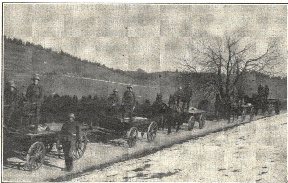
Linientrain-R.-S. Thun 1932 Rückkehr vom großen Ausmarsch