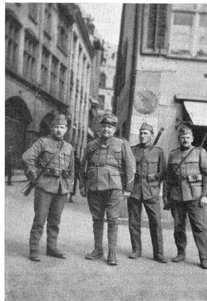
Die siegreichen Landstürmler Les landsturmiens vainqueurs

Um 7.40 Uhr meldete sich die erste Patrouille dem Starter: Inspektion, Uebergabe des Befehls, Orientierung und Abmarsch. In regelmäßigen Zeitabständen folgten die nächsten Patrouillen, bestehend aus je einem Führer, zwei Patrouillenleuten und einem Läufer, die sich im Wettkampf um die Ehre und um die wertvollen Gaben stritten. — Nicht weniger als zehn