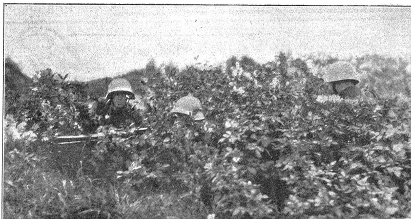
Troupes de montagne couvertes par des buissons en fleurs.