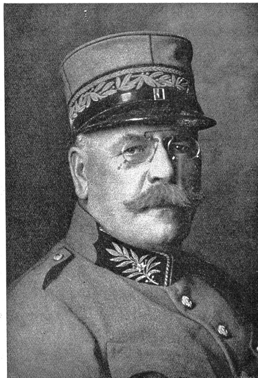
Oberstkorpskommandant A. Biberstein, Kdt. des 3. Armeekorps.