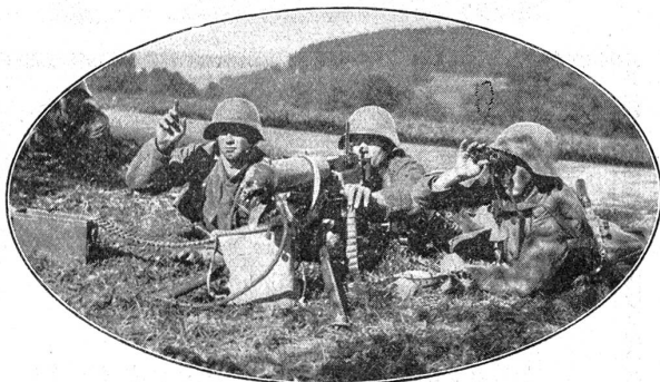
Maschinengewehr-Gruppe im Gefecht. Groupe de mitrailleurs au combat.