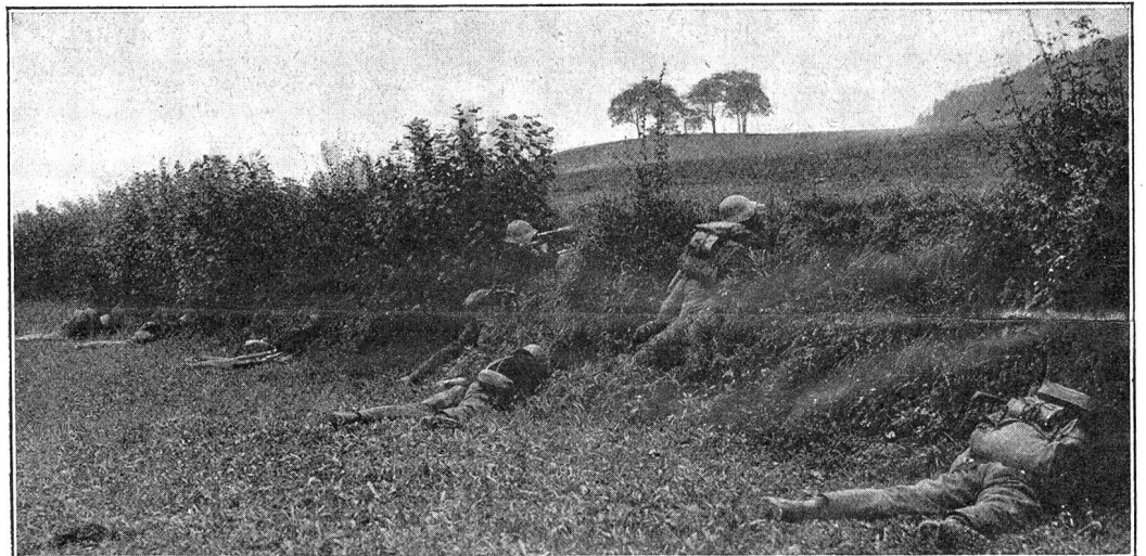
Leichte Maschinengewehr-Gruppe in Deckung. Groupe de fusiliers-mitrailleurs à couvert.