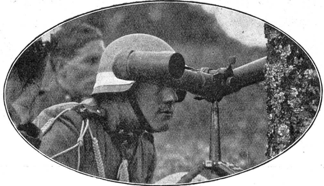
Offiziersposten. — Poste d'officiers.