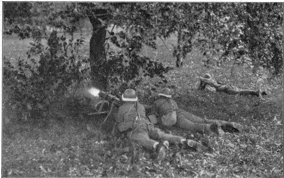
Schweres Maschinengewehr im Feuer.

Frankreich , das vor einigen Jahren die Ausbildungszeit in der Armee von drei Jahren auf zwölf Monate reduzierte, sucht gerade jetzt die militärische Jugendausbildung weiter auszubauen. Eine gesetzliche Neuregelung ist in Vorbereitung. Die ganze Organisation, wie sie Rußland und Italien besitzen, muß hier erst geschaffen werden. Abgesehen von der Frage des gesetzlichen Zwanges ist aber das wichtigste heute schon im Gange. Die körperliche Ausbildung beginnt in der Schule schon mit dem 6. Altersjahre. Ab 1. Oktober 1931 soll täglich in allen Schulen eine halbe Stunde geturnt werden. Als Lehrer für die anschließende militärische Ausbildung werden Offiziere und Unteroffiziere der Armee beigezo-