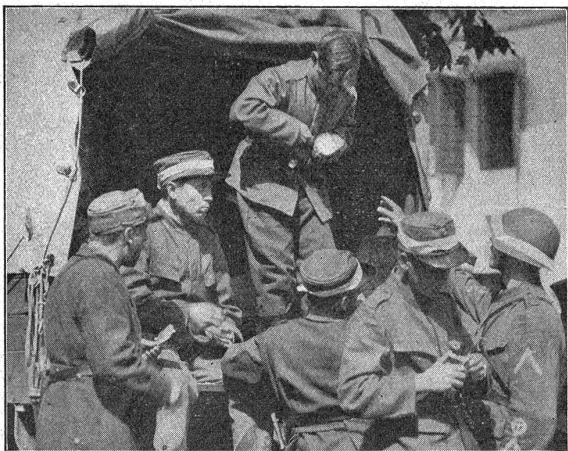
Nie schmeckt trockenes Brot besser als nach strengem Manövertag. Le pain sec ne sent jamais si bon qu'après des jours de manœuvres pénibles. (Phot. Kettel, Genève.)

Die gründliche militärische Vorbildung, die Amerika seiner Jugend angedeihen läßt, ist allgemein bekannt. Vor allem ist zu bemerken, daß teilweise gesetzlicher Zwang zur Teilnahme an den Kursen besteht. Die Aus-