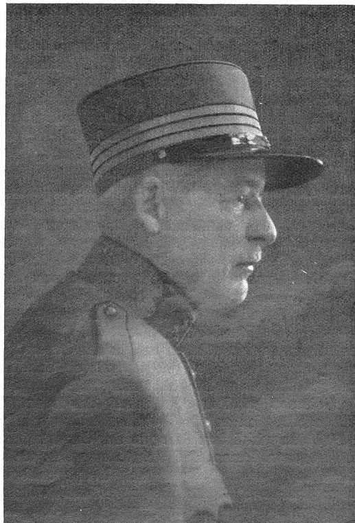
Oberstdivisionär Renzo Lardelli.

Oberstdivisionär Lardelli wurde 1876 geboren. Als Subalternoffizier und Hauptmann diente er im Bündnerbataillon 91 und als Regimentsadjutant im I.-R. 31. Im Jahr 1907 absolvierte er die Generalstabsschule und war als Generalstabsoffizier in der I.-Br. 16 tätig. 1912 er-