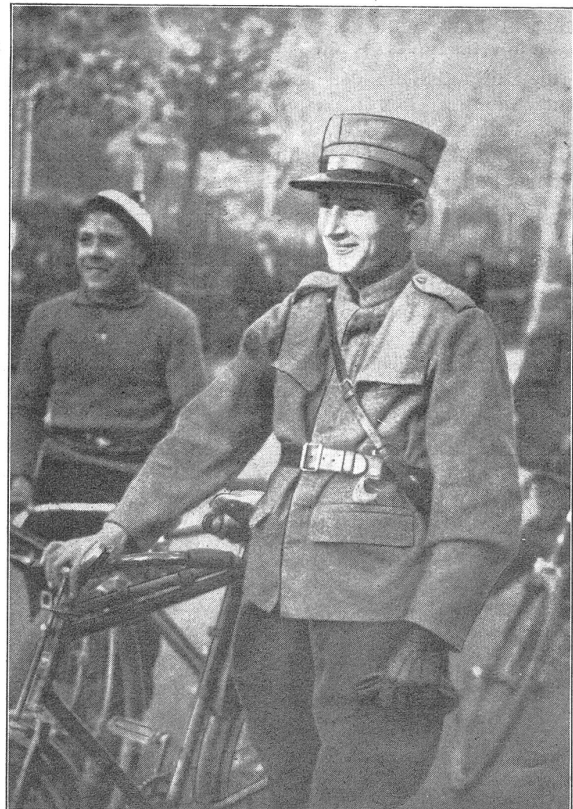
Schweiz. Militärradfahrer-Meisterschaften in Basel.