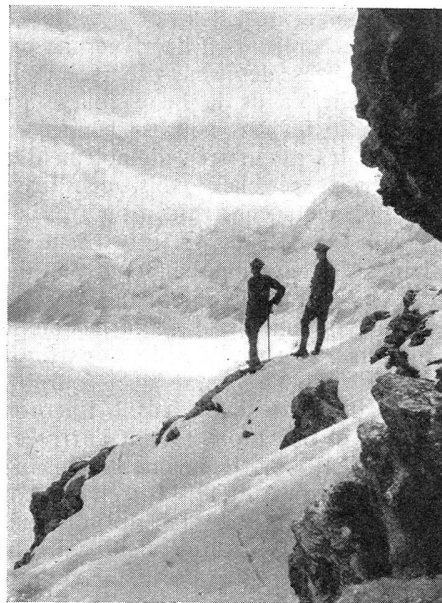
Abendstimmung über dem Kanderfirn Crépuscule sur le glacier de Kander