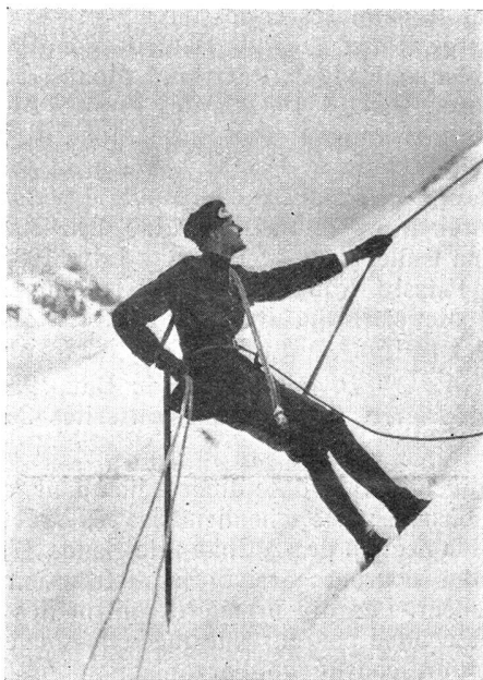
Mit Hilfe von zwei Seilen wird eine Eiswand passiert Avec l'aide de deux cordes une paroi de glace est franchie

Mais le faisceau se resserre et l'étoile de Nicole pâlit sous les témoignages de plus en plus nombreux qui le montrent comme le grand responsable. Tous ses acolytes ne sont que de vulgaires pantins dont il a tiré les ficelles, qu'on se rappelle l'effondrement d'Isaak après