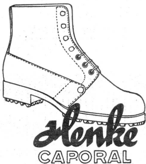
mit dem goldenen Absatznagel

Schiebedose Fr. 1.25, Tuben Fr. 1.25 und 2.— Zu haben in allen Apotheken / Schweizer Präparat