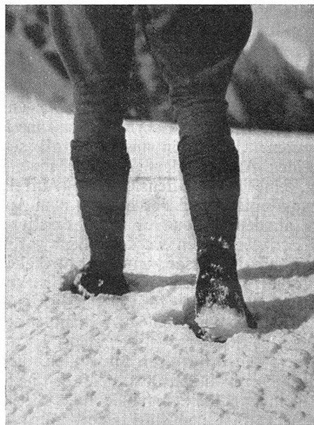
Gleichmäßig geht es weiter, immer einer hinter dem andern Régulièrement on avance, toujours l'un derrière l'autre

Noch interessanter und abwechslungsreicher als die erste, gestaltete sich die zweite Patrouille, welche die Teilnehmer vom Grindelwald über das Wetterhorn nach Meiringen führte. Der Abzug eines September-Freitags brachte die Offiziere bis Grindelwald. Von dort