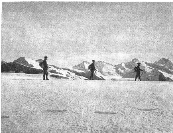
Traversierung von Firn und Gletscher Traversée de névés et de glaciers