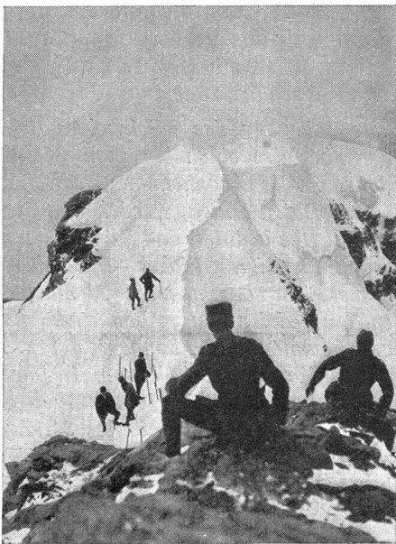
Auf dem Gipfel der Sphinx (Jungfrauoch). Schnee und heftiger Wind machen die Gipfelrast recht unangenehm

Aber nicht allein der Firnenzauber der Alpen, die grünen Weiden und Täler mit den opalblauen Seen und den schmucken, von klaren Flußläufen umspülten Städtchen, machen unser Heimatland so begehrenswert, sondern ebensowohl auch unsere althergebrachten Sitten und Bräuche, unsere bewährten, vorbildlichen Institutionen, und vor allem unsere heißerkämpfte Freiheit und Unabhängigkeit.