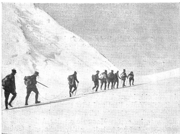
Bald ist die Lötschenlücke erreicht La « Lötschenlücke » va être atteinte

Eine komplette Ueberraschung brachte der folgende Morgen. Hatte es kurz vor Tagwacht draußen noch wie