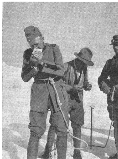
Rast auf dem Großen Aletschfirn

Die Einführung dieser Patrouillenübungen hat unter den Mitgliedern der Offiziersgesellschaft großen Anklang gefunden und gute Erfolge gezeitigt. Nicht nur die erworbenen Kenntnisse auf militärischem Gebiete allein haben die Teilnahme an diesen Gebirgsfahrten wertvoll gemacht, sondern auch die neugepflanzte Liebe zu unsern schönen Bergen und die mächtig geförderte Pflege echter Kameradschaft, welche viel zum vollen Gelingen der Sache beitrugen und damit bleibende Erinnerungen schufen.