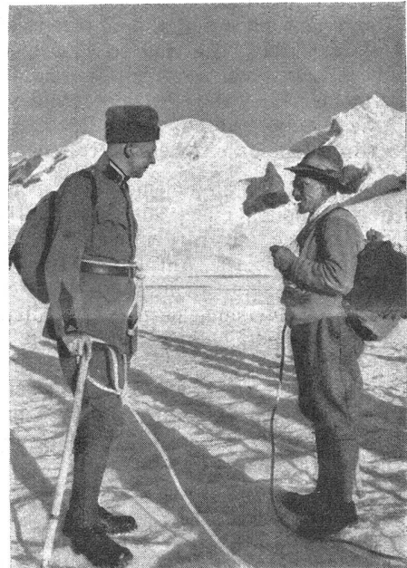
Der Leiter des Patrouillenkurses im Gespräch mit dem Bergführer Le chef du cours de patrouilles en conversation avec le guide de montagne