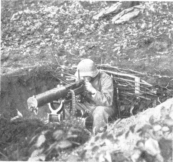
Der Gebrauch des kleinen Schanzwerkzeuges bei der Infanterie Bild 11: Gleiches Mg.-Nest wie in Bild 10, von vorn gesehen.

L'emploi des outils de pionnier dans l'infanterie