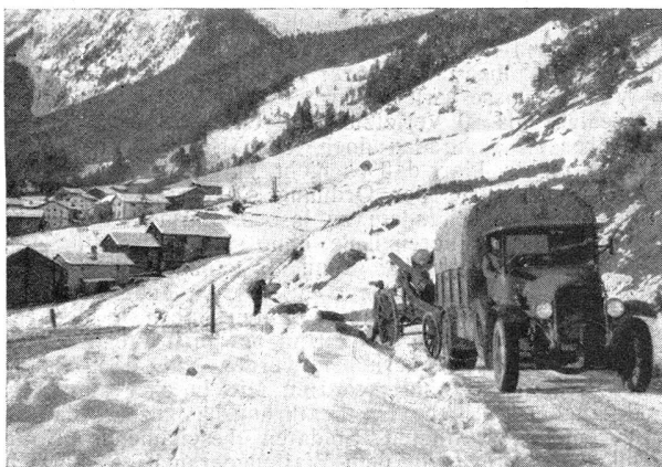
12-cm-Kanone auf einer Bergstraße Pièce de 12 cm sur une route de montagne

On a en général quelque peine à se faire à l'idée que nos canons lourds, autrement dit nos pièces de 120 mm, sont d'excellents canons de montagne, à condition toutefois que par une route carrossable on puisse les amener à pied d'œuvre. Leur trajectoire en effet assez élevée