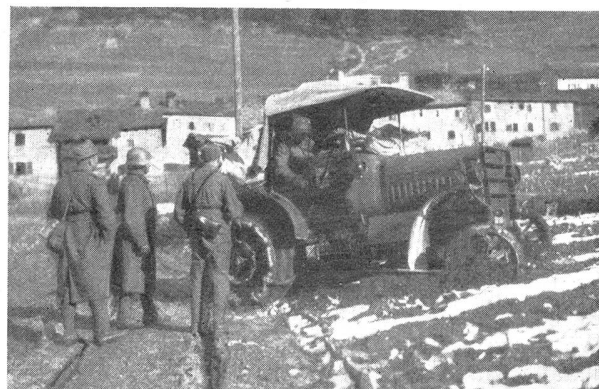
Festgefahrener Traktor — Tracteur embourbé

Une fois que la batterie est arrivée à proximité de