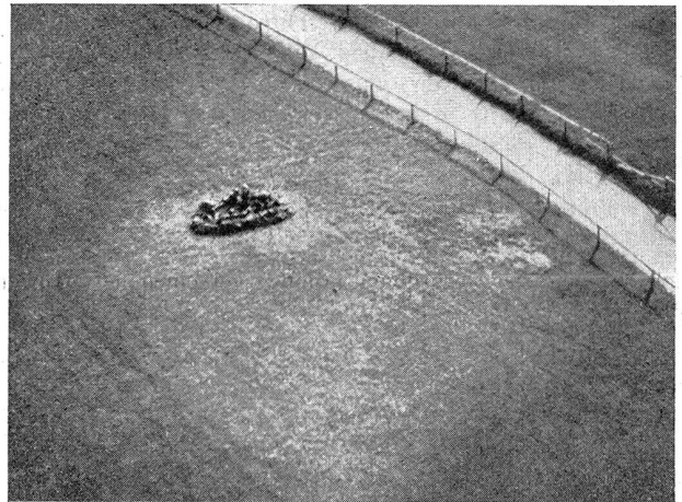
Bild 6. Diese Mg.-Gruppe bezog ihre Stellung bei Nacht. Sie vergaß, auf den Tag bedacht zu nehmen. Ein Mg. aber, dessen Feuerkraft theoretisch jener einer Füs.-Kp. entspricht, ist ein den Tiefflug lohnendes Ziel. Der Flieger wird es angreifen, wenn ihn nicht besondere Aufgaben davon abhalten.

Ein Mg.-Nest, ein gut camouliertes Grabenstück, das wirklich gegen Sicht gedeckt ist, wird nichts zu riskieren haben. Es wird aber vom Flieger angegriffen und auch getroffen werden, wenn es sich in offenes Gelände « setzt », wie dies in Manövern immer noch alltäglich ist. (Bild 6.) (Fortsetzung folgt.)