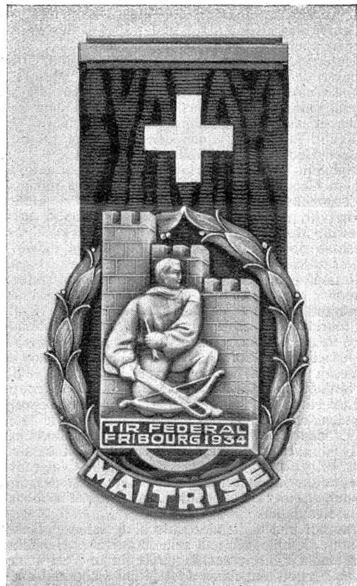
Distinction spéciale en argent pour la maîtrise. Exécutée par la maison Huguenin. L'Arbalétrier est celui de l'envers de la médaille de bronze, œuvre de Willy Jordan.

Le commandant, après s'être mouché bruyamment, s'était levé et marchait à grands pas d'une sentinelle à l'autre pour se donner une contenance.