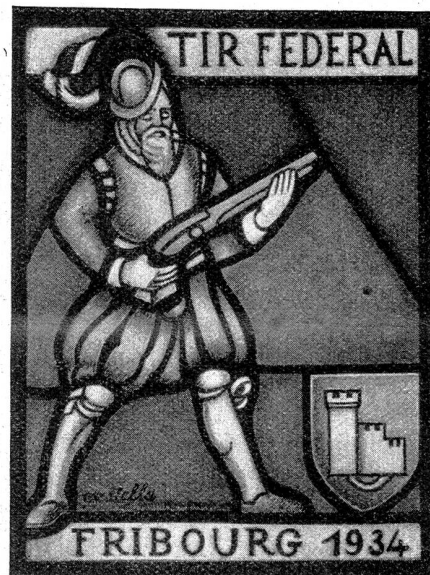
Petit vitrail, 16x22 cm, œuvre de l'artiste-verrier Jean de Castella. Exécuté par les ateliers E. Boss à Berne.

Les quelques modèles que nous reproduisons ici sont à même de satisfaire les goûts les plus difficiles tant par leur caractère artistique que par leur réelle valeur, et ce n'est que justice, car il ne faut pas oublier que si le vrai tireur — qui est un sportif avant tout — n'attache en général que peu d'importance aux prix qu'il obtient, il est malgré tout sensible à une récompense méritée qui vient couronner un succès dû,