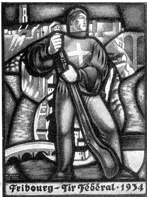
Grand vitrail, 27x36 cm, d'après les cartons de Willy Jordan. Exécuté par les peintres-verrières Kirsch & Fleckner à Fribourg.

Qui dira le bienfait des émotions salutaires provoquées par l'évocation du pays lointain? Tous ces hommes rudes qui étaient là pour expier une faute de jeunesse, pour fuir un chagrin d'amour ou tout simplement attirés par l'esprit d'aventures, pensaient en cet instant à leur vie mal commencée et prenaient de bonnes résolutions pour le moment où leur engagement serait terminé. Sans que l'on s'en aperçût le feu s'était éteint, petit à petit les visions s'étaient évanouies et les hommes uns à uns s'étaient endormis. Il ne restait plus d'éveillées que les sentinelles faisant les cent pas.