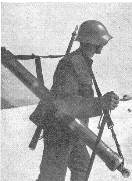
Der Minenwerferträger. Porteur de lance-mines.

Die Rückfahrt nach Luzern, bei etwas bewegter See, zeigte uns nochmals die schönen Gestade des Vierwaldstätter