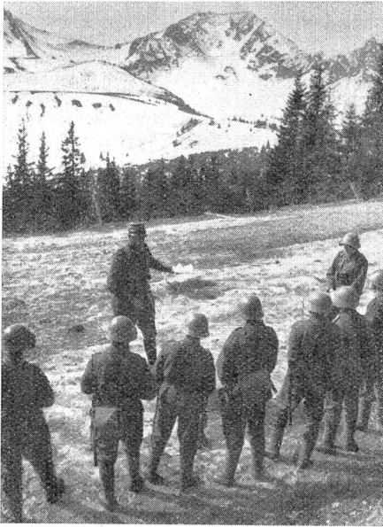
Bei der Besprechung der Schießübung. La théorie sur l'exercice de tir.