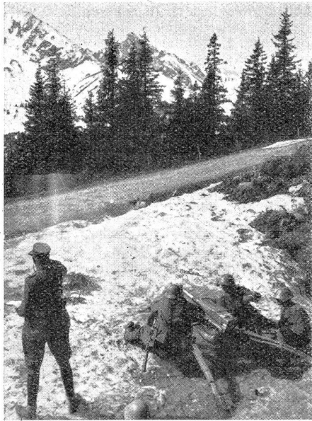
Schwere Infanteriewaffen. Infanteriekanone im Feuer in den Alpen. Les armes lourdes de l'infanterie. Un canon d'infanterie en action dans les Alpes.