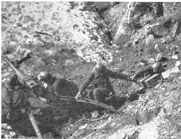
Laden und Richten der Infanteriekanone. Le chargement et le pointage du canon d'infanterie.

Anmeldung: Um eine geordnete Verpflegung sicherzustellen ist vorherige Anmeldung per Postkarte unbedingt notwendig bis spätestens 24. Juni 1934 an das Organisationskomitee Wangen a. d. A.