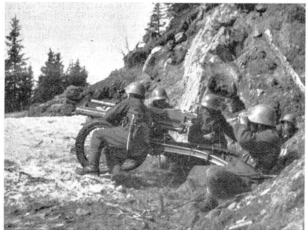
Die Infanteriekanone im Augenblick des Abschusses. Deutlich ist die Wirkung des Rohrrücklaufes sichtbar.

An diesen Meisterschaften, die in allen drei Waffen: Degen, Fieuret und Säbel, durchgeführt werden, sind alle Offiziere, Unteroffiziere und Soldaten zugelassen, die im Besitze der