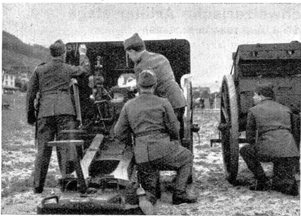
Bei der Geschützschule: „Seite anschreiben“ Ecole de pièce: „Inscrire la dérive“