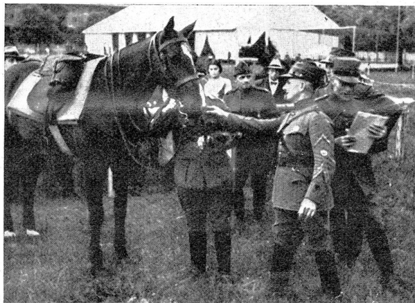
Beim Nachprüfen der Sattelung und Zäumung Le contrôle du sellage et du bridage