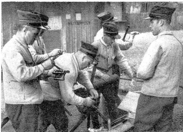
Bild 2. Landsturm-Mitr.-Offiziere beim Parkdienst Photo 2. Officiers mitrailleurs du landsturm pendant le service de parc

wurden im Verlaufe des Kurses den Teilnehmern die wichtigsten der Armeefilme vorgeführt — die Demonstration des Minenwerfers und der Infanteriekanone und anschließend Scharfschießen mit MG auf Flugzeugziele auf kurze Distanzen. Gerade dieses Schießen fand besonderes Interesse bei jenen Offizieren, deren Einheiten bei einer Kriegsmobilmachung mit dem Luftschutz wichtiger Punkte betraut sind.