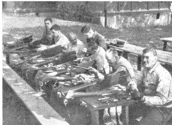
Bild 3. Landsturm-Mitr.-Offiziere bei der Mg.-Kenntnis, Mod. 1894 Photo 3. Officiers mitrailleurs du landsturm; connaissance de la mitrailleuse, mod. 1894