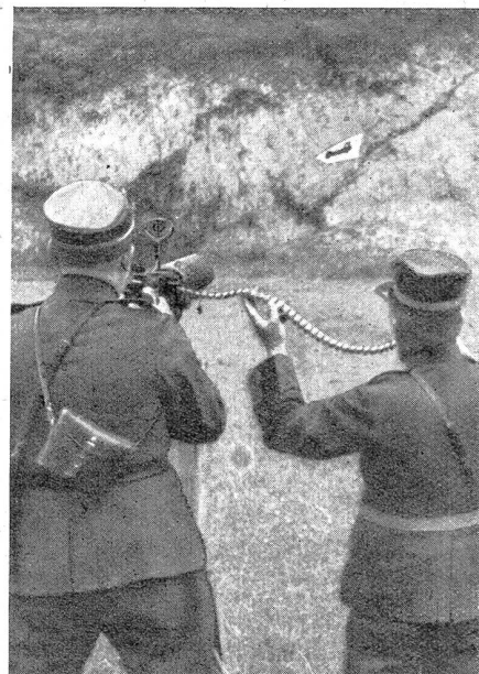
Bild 5. Schießen auf bewegliche Flugzeugziele auf dem Schießplatz Wallenstadt. Mittels eines Haspels wird die Flugzeugscheibe mit beträchtlicher Geschwindigkeit auf eine Distanz von über 100 m vor dem Maschinengewehr vorübergezogen. Der Schiessende visiert nach dem bei Bild 4 angeführten System das Ziel an und feuert, ohne jedoch dem Flugzeug mit der Visierlinie zu folgen. Gleich die erste Schießübung ergab ein Resultat von vier Treffern im schwarzen Flugzeug selbst und sieben Treffer im weißen Teil der Scheibe.

(Korr.) Deutschlands Rüstungsausgaben beliefen sich in der Zeit von 1931 bis 1933 jährlich auf rund 657 Millionen Mark, wovon 474 Millionen auf das Reichsheer entfielen und 183 Millionen auf die Marine. Der Voranschlag für 1934 aber sieht plötzlich bedeutend größere Beträge vor. Für die Landarmee sind diesmal 574 Millionen für laufende, plus 80 Millionen für einmalige Ausgaben eingesetzt. Bei der Marine sind vorgesehen 128 Millionen für laufende und 108 Millionen für einmalige Ausgaben. (Kiellegung neuer Kriegsschiffe.) Heer und Marine verschlingen somit zusammen 890 Millionen, das