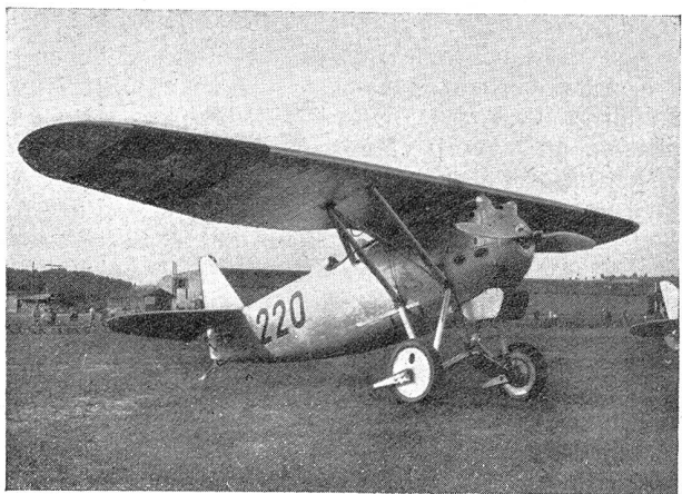
Dewoitine-Maschine Appareil Dewoitine

Les invités supérieurs. Les colonels divisionnaires Hilfiker (assis), Lardelli et von Salis