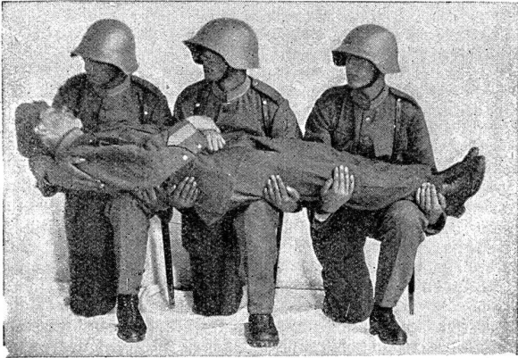
Bild 7. Von der gesunden Seite her anfassen (das rechte Bein sei gebrochen und geschient). Einer befiehlt. 1. Phase.

Photo no. 7. Tenir du côté intact (la jambe droite est cassée et munie d'attelles); un des hommes commande. 1 re phase.