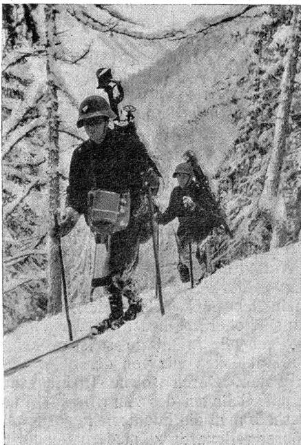
Gebirgsdienst — Beschwerlicher Aufstieg auf Ski. Gegend von Ronco (Bedrettotal) Service en montagne — Une montée pénible sur skis. Environs de Ronco (Val Bedretto)

Charakter des neuzeitlichen Feuerkampfes. Die Verteidigung versucht durch ihr Abwehrfeuer zu verhindern, daß der Feind die Zone vor der Stellung durchschreiten und die Stellung nehmen kann. Die Tätigkeit während