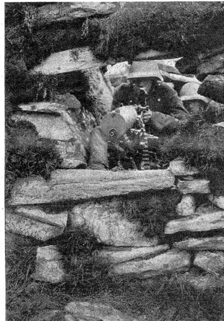
Gebirgsdienst — Maschinengewehrstellung. Südosthang vom Monte Prosa ca. 2400 m Service en montagne — Position de mitrailleuse. Versant sud-est du Monte Prosa à env. 2400 m

In allen übrigen Gefechtslagen, die nicht so ausgesprochenen Charakter besitzen wie die hier geschilderten, dreht es sich um die gleichen Ziele, nur in kleinerem Maßstab. Im Begegnungsgefecht bilden sich lokal sofort Verteidigung und Angriff heraus. Hinhaltender Kampf ist sukzessive Verteidigung, Verfolgung ist sukzessiver, immer wieder von neuem ansetzender Angriff. Die Feuerprobleme für die Infanterie bleiben dabei dieselben, nur nicht in so stark ausgeprägter Form.