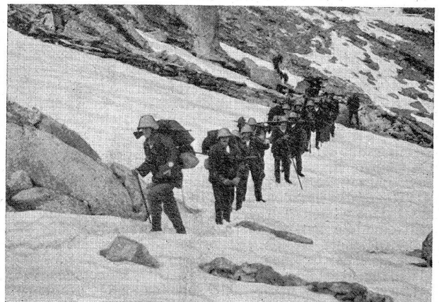
Gebirgsdienst — Atempause, nordöstlich Lago Orsino Service en montagne — On reprend son souffle. Au nord-est du lac Orsino

Jedermann wird erkennen, daß bei der Seele des Vaterlandes, dort oben, wo die wahre Heimat liegt, inmitten der Alphütten die Tagwache heller in die klare Luft hinausschmettert. — Die Berge reden eine eindringliche Sprache; sie reden uns vom Aufstieg der Seele, durch den allein die großen Eigenschaften erreicht werden, vom Gehorsam bei der Ueberwindung von Anstrengungen, der Unterwerfung unter einen höhern Willen, der Ergebung und Aufopferung, die nötig sind, um das in Licht und Wahrheit strahlende Ziel, die freiheitschimmernden Gipfel, zu erreichen, auf denen die erhobene Hand den Himmel zu berühren scheint. Wenn mit der lebenspendenden Sprache sich im Herzen