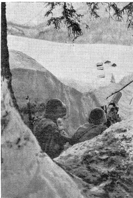
Gebirgsdienst — Maschinengewehrstellung. Gegend von Ronco (Bedrettal) Service en montagne — Position de mitrailleuse. Environs de Ronco

zu denen das ganze Volk mit großer Begeisterung herbeiströmt. Und wenn sie dann daran teilnimmt, besticht sie nicht durch ihre Schönheit, so wenig, wie dies der Enzian oder die Soldanelle in einem botanischen Garten tut. Der Massenschritt der Bataillone, die flinken Schwadronen, die schweren, von den Gespannen rasch dahingeführten Feldkanonen, stellen unsere langsam schreitenden, die Hufe im Staub hinschleppenden Maultiere in den Schatten. — Da oben aber im Gefecht, da oben in den Steinhalden, auf dem von Abgründen umgebenen Grat, — da muß man unsere Maschinengewehre sehen. Ist doch das Gebirge der Kriegsschauplatz, wo die Masse wenig, die Manneskraft alles gilt; der behauptet das Gebirge, der es beherrscht mit Beinen von Stahl, der es beherrscht durch die Ausdauer seiner Lungen und durch die Härte gegen Hitze und Kälte, gegen Schnee und Wetter. Im Gebirge wird ein Großteil der Manneskraft verbraucht im Kampf mit den Flüchen der Berge, und nur der Rest wird frei zum Kampf gegen den Feind; der siegt, der über den größeren Rest verfügt. Das Gebirge ist ein Freund des Kriegers, aber nur des starken, selbständigen, pflichtgetreuen Kriegers.