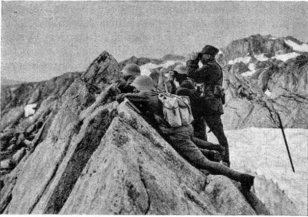
Gebirgsdienst — Aufklärungsdienst, nördlich Lago Orsirora ca. 2500 m Service en montagne — Poste de guetteurs. Au nord du lac Orsirora à env. 2500 m

tung, der in der von ihnen verwirklichten Konzentration der Feuerquelle liegt.