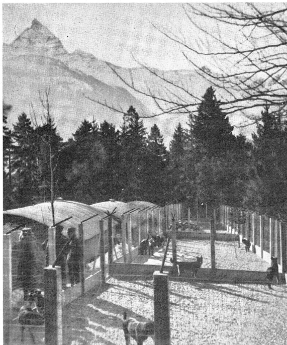
Der Hundezwinger für Armeemeldehunde in Savatan (St-Maurice). Rechts die verschiedenen Laufgehege, links die Unterkunftshütten für Meldehunde. Le chenil pour chiens de liaison à Savatan (St-Maurice). A droite les enclos, à gauche les refuges des chiens de liaison.