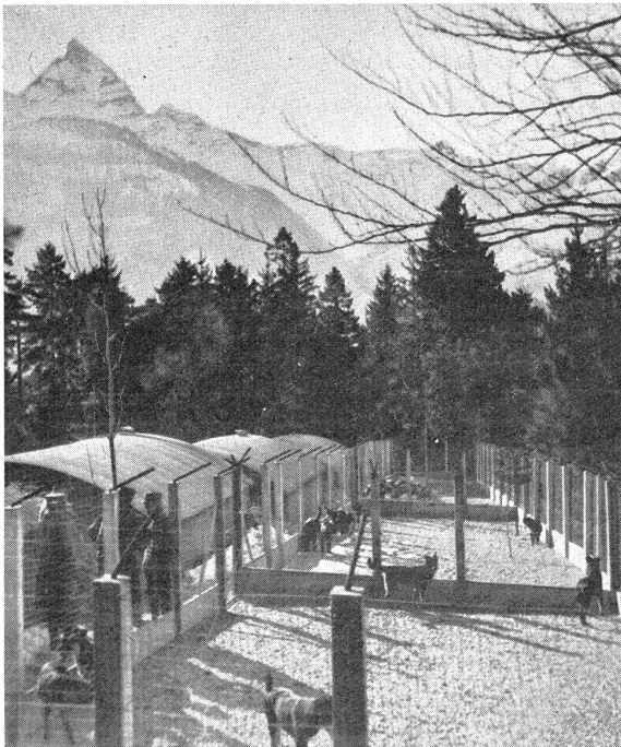
Der Hundezwinger für Armeemeldehunde in Savatan (St-Maurice). Rechts die verschiedenen Laufgehege, links die Unterkunftshütten für Meldehunde. Le chenil pour chiens de liaison à Savatan (St-Maurice). A droite les enclos, à gauche les refuges des chiens de liaison.