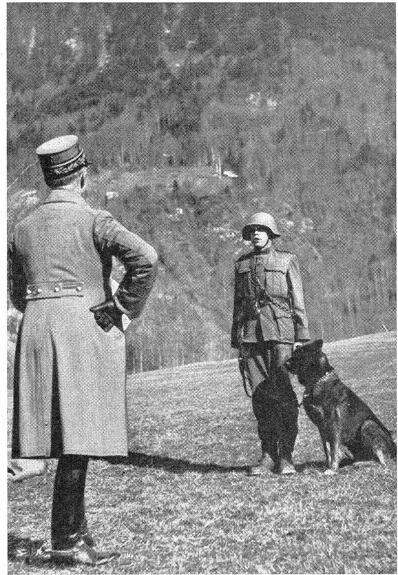
Oberstkorpskommandant Guisan, Kommandant des 1. Armeekorps, bei der Inspektion einer Meldehundabteilung. Le Colonel commandant du premier corps d'armée, H. Guisan, passant à l'inspection d'une équipe de chiens de liaison.