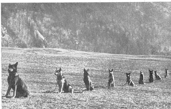
Gehorsamsprüfung für Meldehunde: Die Meldehundeführer sind ohne Tiere abmarschiert, die Hunde müssen auf ihrem Platze verweilen bis ihr Führer zurückkehrt.

Während dieser kurzen Besichtigung hatten sich die Equipen des Meldehunde-kurses I/1935 nördlich der Ortschaft Lavey zur Inspektion aufgestellt. In viertelstündiger Fahrt ging es nun sofort dorthin, wobei sich von der Militärstraße Lavey—Savatan ein wunderbarer Blick auf- und abwärts auf das Rhonetal bot. — Nach erfolgter Meldung des Kurses durch den Detachementschef und Instruktor, Hauptmann Liechti, schritt der inspezierende Kommandant des I. Armeekorps sofort zur Einzelbesichtigung, wobei er sich speziell auch über die Zusammensetzung der einzelnen Equipen, Unterkunfts- und Trainingsmöglichkeiten derselben zu Hause usw. informierte. — Eine viertelstündige Dressur — und Gehorsamsprüfung der Meldehunde in der Abteilung — eine Art Zugsschule — schloß sich hierauf an: verschiedene Marschübungen in Linie, Einerkolonne mit Richtungsänderungen und Formationswechseln waren neben Übungen im Anhalten, Liegen usw. durchzuführen, ohne daß die Hunde durch weiteres Kommando als jenes des Detachementschefs und ein Zeichen ihres Führers dirigiert worden wären. In verschiedenen Formationen wurde auch gezeigt, wie die Tiere auch ohne die