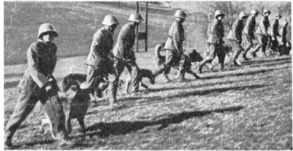
Meldehundeabteilung in Linie bei einer Gehorsamsprüfung (Marschübung). Equipe de chiens de liaison marchant en ligne à l'occasion d'un exercice d'obéissance.

Speziell auf kriegstechnischem Gebiete tastet der Laie ganz im finstern und schreitet in Ungewißheit, weil er nicht weiß, was mit seinen Lieben und seinem Besitz geschieht, wenn diese durch die allgewaltige Luftmacht feindlicher Staaten bedroht und gefährdet werden.