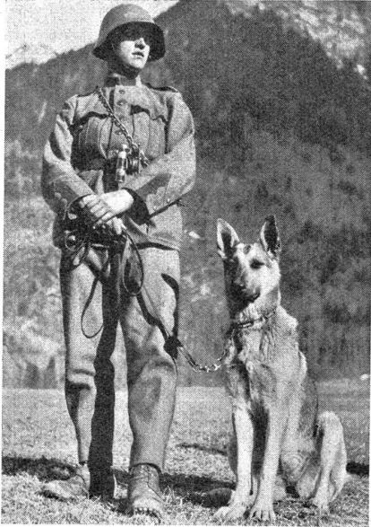
Meldehund und sein Führer. Un chien de liaison avec son guide.