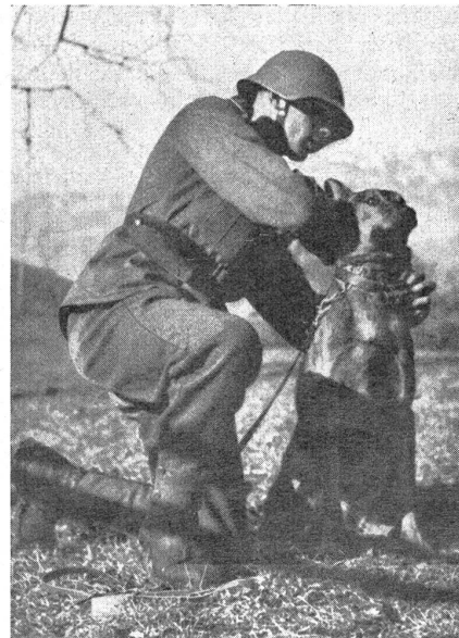
Beim Anziehen der Meldepatrone. La cartouche de liaison est fixée au cou du chien.

Der Ruf nach Befestigungen im Grenzgebiet beginnt sich zu erheben. Bekanntlich hat die Bundesversammlung in der Dezembersession 1933 einen Kredit von vorläufig 6 Millionen bewilligt, um im Rahmen des Arbeitsbeschaffungsprogramms mit der Vornahme von Befestigungsarbeiten einsetzen zu können. Die Vorarbeiten sollen nun beendet sein, so daß mit dem Bau der Werke begonnen werden könnte. Noch ist aber bis heute nichts darüber bekannt geworden, wann die ersten Spatenstiche erfolgen sollen. Daß sich eine gewisse Ungeduld und Besorgnis im Volke zeigt, ist angesichts der heutigen politischen Lage in Europa verständlich. Viele Tausende arbeitsloser Wehrmänner, die, wie wir hoffen, in erster Linie Berücksich-