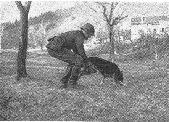
Er wird nach wenigen Schritten von seinem Führer losgelassen. Après quelques pas son guide le lâche.

(Eing.) Die Ballon-Kp. 3, Kdt. Hr. Hauptm. Siegfried Hans, Kirchberg/B., die zur Zeit im Verbands des Schw.-Art.-Reg. 1 in La Tour de Trême (Freiburg) ihren Wiederholungskurs absolviert, hielt vergangenen Freitag den 5. April 1935 im Kantonamentsort ihren Kp.-Abend, an welchem auch der bestbekannte Soldatenliedersänger Hanns Indergand mit großem Erfolg mitwirkte. Im Verlaufe des Abends wurde auf Anregung eines Soldaten eine Tellersammlung für die Bekleidung bedürftiger Schulkinder durchgeführt, welche den schönen Betrag von