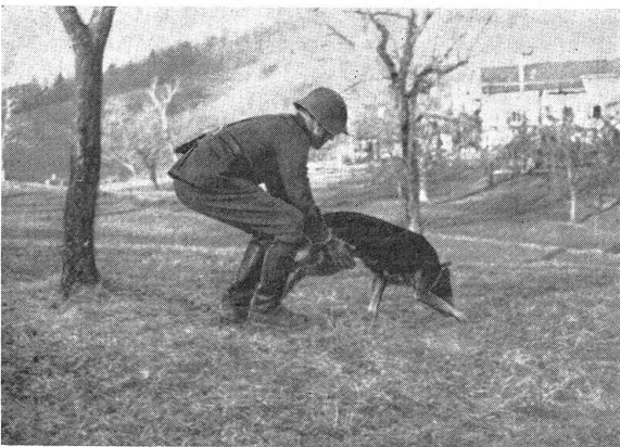
Er wird nach wenigen Schritten von seinem Führer losgelassen. Après quelques pas son guide le lâche.