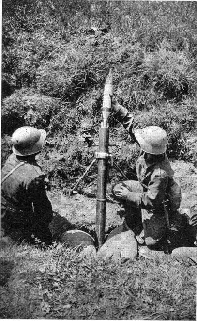
Fig. 7. Mortier en position dans un fossé. Le tireur s'apprête à laisser tomber dans le tube une mine à grande capacité. Le trait blanc sur le tube sert à mettre l'arme en direction au moyen du fil à plomb.

angle de chute provoque autour du point d'impact une gerbe circulaire d'éclats.