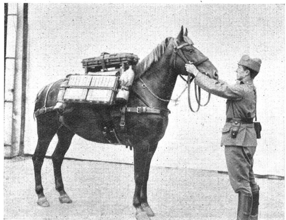
Fig. 10. Caissettes à munition bâties.

Si par contre le projectile tombe avec peine dans le tube, l'air ne peut pas s'échapper et en se comprimant freine le projectile et la cartouche ne frappant pas assez fort sur le percuteur ne peut s'enflammer.