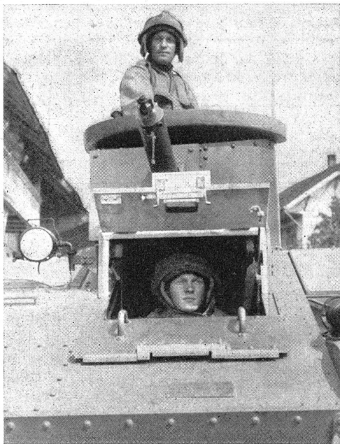
Die Besatzung eines Panzerwagens während eines Vormarsches an den Gegner. Aussichtsclappe des Führers und Panzerturm des Schießenden sind noch geöffnet, an der Aussichtsclappe (unten) ist deutlich die Dicke der Panzerplatten (13 mm) erkennbar.

Les servants d'une auto blindée pendant une avance contre l'ennemi. La fenêtre du conducteur et la tour blindée du tireur sont encore ouvertes. On remarque distinctement vers la fenêtre (dessous) l'épaisseur des plaques blindées (13 mm).