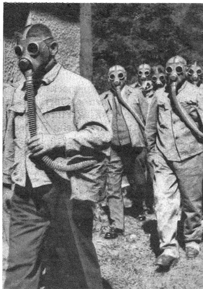
Der Marsch nach der Gaszelle. Hier wird die definitive Kontrolle der Gasdichtigkeit der Maske vorgenommen. Die Gaszelle ist mit dem harmlosen Tränengas „vergast“ und unrichtiges Anpassen der Gasmasken wird bald entdeckt. En route pour la cabine à gaz. Ici l'imperméabilité du masque contre les gaz est définitivement contrôlée; la cabine à gaz est „gazée“ avec du gaz lacrymogène inoffensif, et une fixation incorrecte du masque est bientôt découverte.