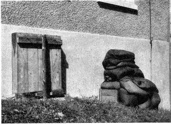
Passiver Luftschutz. Luftschutz-Raum. Die äußere Abdichtung der für Luftschutzräume vorgesehenen Keller erfolgt entweder durch eine starke Auflage von Sand- und Erdesäcken (Fenster rechts) oder aber durch einen Holzverschlag von mindestens 50 cm Tiefe, der mit fest zusammengestampfter Erde ausgefüllt wird (Fenster links).

Protection passive contre les gaz. Local de protection contre les gaz. L'obstruction extérieure de la cave prévue comme local de protection contre les gaz se fait soit par un fort empilement de sacs de sable et de terre (fenêtre de droite) soit par une cloison de bois, profonde d'au moins 50 cm, qui devra être remplie de terre pressée (fenêtre de gauche).