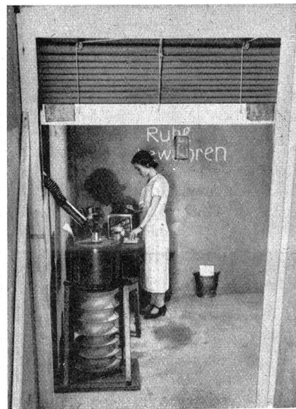
Passiver Luftschutz. Luftschutz-Raum. Blick in den Luftschutzraum von außen her. Mittels einer Jalousietüre aus imprägniertem Segeltuch-Gummistoff ist hier eine sog. Gasschleuse hergestellt, wie sie bei keinem Luftschutzraum fehlen darf. Hier spritzen sich alle Personen, die den Schutzraum benützen wollen, vor dessen Betreten mit Chlorkalklösung ab, d. h. sie desinfizieren sich gegen event. schon anhaftende Gase. Die Gasschleuse liegt zwischen dem Luftschutz-Vorraum und dem eigentlichen Luftschutzraum. Vorn im Bild links ist ein mechanischer Luftzuführapparat mit Reinigungsfilter sichtbar, mit welchem bei starker Beladung des Schutzraumes der Aufenthalt darin beliebig lang ermöglicht wird.

Protection passive contre les gaz. Local de protection vu depuis l'extérieur. Au moyen d'une porte-jalousie en toile à voile imprégnée-étouffée caoutchoutée, est installée ici une écluse à gaz comme elle ne doit manquer dans aucun local de protection contre les gaz. Ici doivent s'asperger au moyen d'une solution de chlore et de chaux, avant d'entrer dans le local même de protection, toutes les personnes qui veulent utiliser ce dernier, afin d'être désinfectées contre les gaz qui auraient déjà adhéré. L'écluse à gaz est située entre le premier local de protection et le local de protection proprement dit. On remarque à gauche, sur la présente photographie, un appareil mécanique pour la conduite de l'air, avec filtre épurateur, au moyen duquel, en cas de forte occupation du local de protection, le séjour peut y être prolongé à volonté.