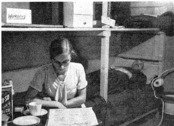
Passiver Luftschutz. Luftschutz-Raum. Zweck der Luftschutzräume wird sein, sowohl vor Bombengasen, wie auch vor Bombensplittern Schutz zu bieten. Unser Bild gibt einen guten Überblick, wie ein solcher Luftschutzraum einzurichten ist: Lagerstellen für Kranke und Gebrechliche, Proviant, Eßgeschirr, Werkzeug, eine Notapotheke, eine Nottoilette, elektrische Taschenlampen usw. werden für den vielleicht auf Stunden sich ausdehnenden Aufenthalt im Luftschutzraum nötig sein.

Unfall, Krankheit und Invalidität zu unterstützen, daß dieser selbe Staat es sich gefallen lassen soll, sich von seinen verwöhntesten Zöglingen begeistern und bekämpfen zu lassen. Es ist heute bitter notwendig, entschieden und mannhaft gerecht, aber hart zu sein. Es ist nicht notwendig, daß wir alle gleichgeschaltet seien. Erhalten wir unsere persönliche Freiheit im Rahmen unseres Rechtes und Ordnungsstaates; aber lernen wir wieder erkennen, daß es ganz gleichgültig ist, ob unser Nachbar katholisch oder reformiert, freisinnig oder Angehöriger einer Front, Bauer oder Arbeiter sei, daß es nur darauf ankommt, ob er treu und ehrlich sei und ob er anerkenne, daß Recht und Gesetz unbeugsam sein sollen und daß der Bürger eines Staates nicht nur Rechte, sondern auch Pflichten hat. Wenn Einigkeit und Gerechtigkeit nichts mehr gelten sollen und wenn nicht sehr bald