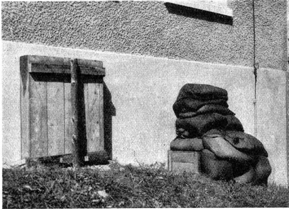
Passiver Luftschutz. Luftschutz-Raum. Die äußere Abdichtung der für Luftschutzräume vorgesehenen Keller erfolgt entweder durch eine starke Auflage von Sand- und Erdesäcken (Fenster rechts) oder aber durch einen Holzverschlag von mindestens 50 cm Tiefe, der mit fest zusammengestampfter Erde ausgefüllt wird (Fenster links).

Protection passive contre les gaz. Local de protection contre les gaz. L'obstruction extérieure de la cave prévue comme local de protection contre les gaz se fait soit par un fort empilement de sacs de sable et de terre (fenêtre de droite) soit par une cloison de bois, profonde d'au moins 50 cm, qui devra être remplie de terre pressée (fenêtre de gauche).