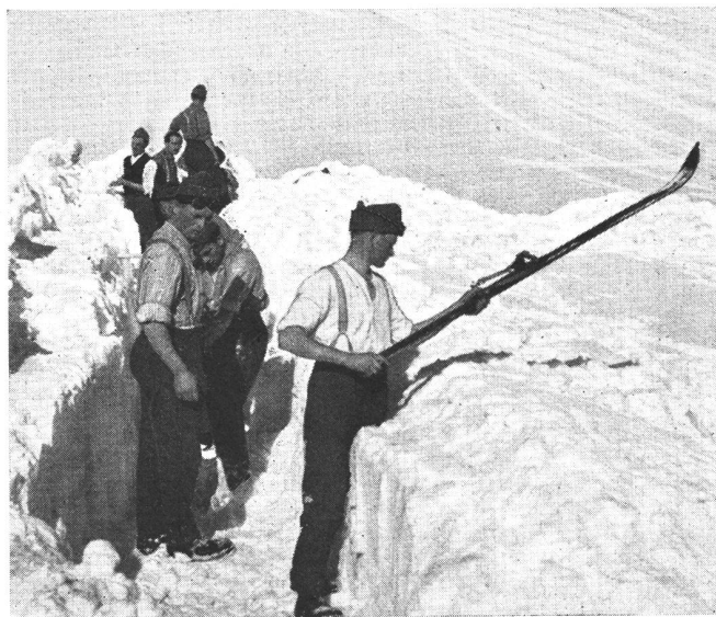
Gebirgsinfanteristen beim Ausheben eines Schützengrabens im Schnee. Mit einem Ski werden die Brustwehren festgeschlagen.

Fusiliers d'infanterie de montagne creusant une tranchée. Les parapets sont fixés solidement au moyen d'un ski.