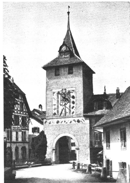
Das mit historischen Malereien reichverzierte Stadttor am Eingang zum Städtchen Sempach.

Und nieder knien die Massen, Sie beten still zu Gott, Er wird sie nicht verlassen In herber Kampfesnot.