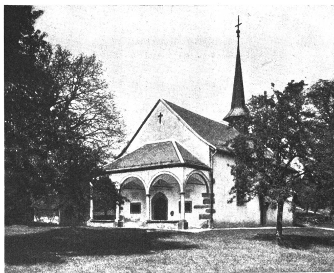
Die historische Schlachtkapelle auf dem Schlachtfeld oberhalb des Städtchens Sempach.

Von Helden hör' ich singen, Voll biedrer Schweizerkraft, Die in gewalt'gem Ringen Besiegt die Ritterschaft.