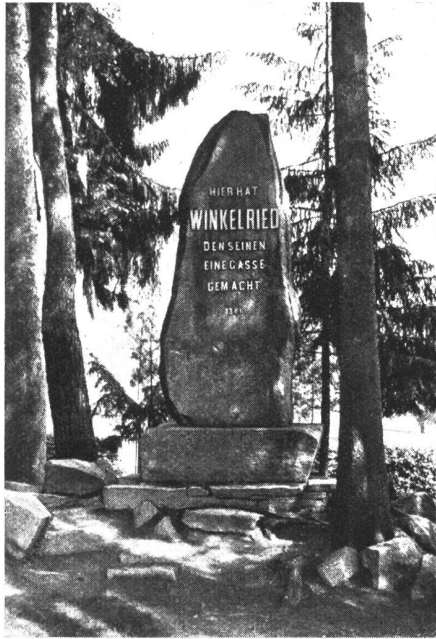
Der Winkelried-Gedenkstein oberhalb des Städtchens Sempach.

La pierre érigée en mémoire de Winkelried, au-dessus de la petite ville de Sempach.