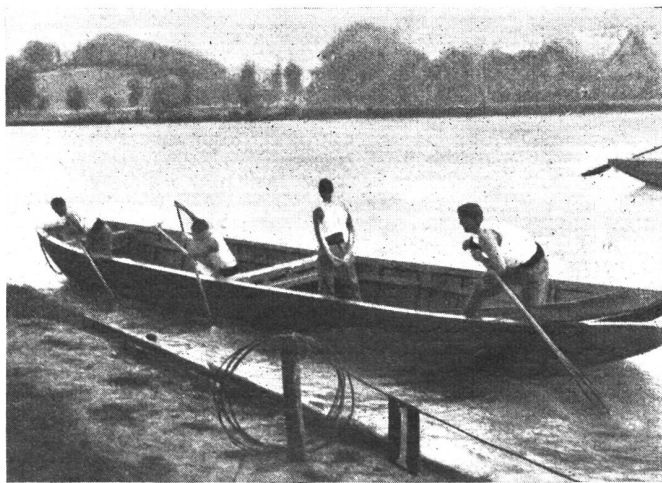
Stachelarbeit flußaufwärts. Travaux de barbelés en amont du fleuve. Lavoro d'asta per rimontare la corrente.

In Olten fand Ende Juni ein Jugendtag für den Frieden statt. Neben den kommunistischen Veranstaltern nahmen daran protestantische und katholische Jugendgruppen teil, deren «Friedensbekenntnis» in der Abstimmung dann natürlich durch die kommunistische Mehrheit in passendem Sinne geformt wurde. Der Weltfriede will von diesen hinter den Ohren noch feuchten Jungen und Mädels erreicht werden durch das Mittel der Hetze. Der Jugendtag verurteilte die Politik des Bundesrates wegen Vertragsbruch, begangen durch die Aufhebung der Sanktionen und wegen Verfassungsverletzung durch Schaffung von Luftschutzbestimmungen auf dem dringlichen Wege des Bundesbeschlusses. Wie werden unsere sieben geplagten Mannen in Bern niedergeschlagen und zerknirscht gewesen sein, als sie von diesem doch sicher maßgebenden Urteil über ihr Tun und Lassen durch die weisen Jüngelchen hörten! Für den Herbst ist in Genf ein Weltfriedenskongreß geplant, wiederum kommunistisch aufgezogen. Die Verehrer des blutrünstigen Russenregiments sind ja die berufensten und qualifiziertesten Hüter des Friedens. *