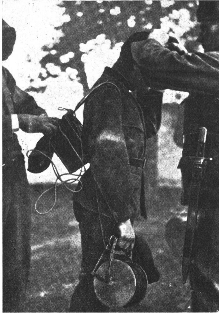
Beim Ausrüsten einer Telephonpatrouille. Une patrouille du téléphone s'équipe. La partenza di una pattuglia telefonisti.