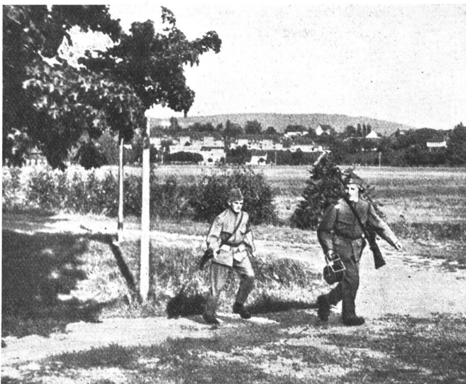
Aus der Konkurrenz für Telephon-Patrouillen: beim Linienbau nach dem Höckler.

Wohl aus Gründen der Zeitersparnis wurde der optische Signaldienst nur auf kurze Distanz von beiden Ufern der Sihl aus zur Abwicklung gebracht; bei größeren Distanzen dürfte sich wohl das Ablesen der Signale nicht so einfach gestalten und würde wohl von selbst zur Anwendung des Feldstechers führen, wie dies im Felddienst wohl die Regel sein wird. Neben den praktischen Uebungen im Uebermitteln und Abnehmen von