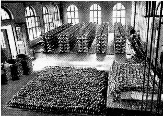
Brotmagazin der Bäcker-Kompanie 8 im WK 1935 in der Turnhalle Langstrasse in Zürich. Enthaltend: 23,000 Portionen Brot. Erbacken am 13./14. 9. 35. Gefaßt am 14. 9. 35. abends, von der Vpf.-Abt. 5.

Magasin à pains de la cp. boulangers 8, au C.R. 1935, dans la salle de gymnastique de la Langstrasse, à Zurich. Contenance: 23,000 portions de pain. Cuites les 13/14. 9. 35. Touchées le 14. 9. 35 au soir par le Gr. subs. 5.