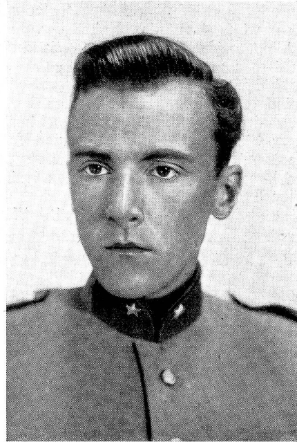
Wer in Vaterlandsdienst sein Herzblut vergossen, Wird weiterleben im Walhall der Eidgenossen.