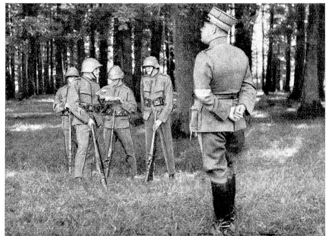
Patrouillenlauf. Vor Abgang der Patrouille hatte deren Führer seine Patrouilleure in Anwesenheit der Kampfrichter über die erhaltene Aufgabe zu orientieren. Diese Orientierung sowohl, wie auch die anschließende Befehlserteilung durch den Patrouillenführer fiel bereits unter die Bewertung durch die Kampfrichter.

Im Laufe dieses Monats haben Sitzungen und Besichtigungen der Kommissionen des National- und Ständerates für die Vorlage über die weitere Verwendung des Wehranleihfonds