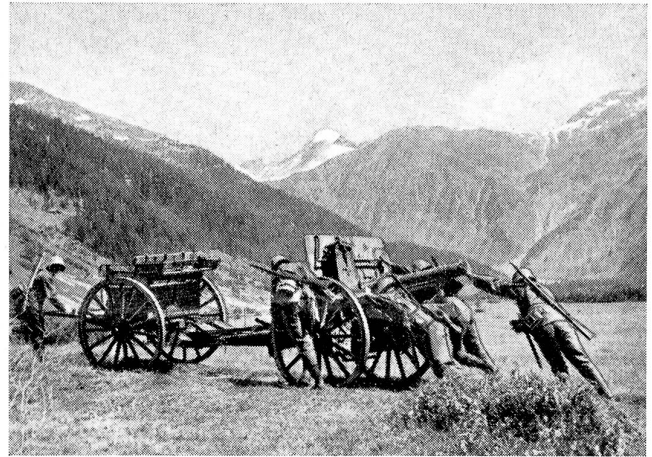
Aufpacken nach vorne auf die Straße zur Wagenkolonne. Im Hintergrund der Galenstock.

Um sieben Uhr stellten wir das Tännchen in die Wirtsstube hinab. In ein paar Minuten hatte sich die Osteria ganz mit Leuten aus dem Dorf gefüllt. Oh, die vielen glänzenden Kinderaugen, die zum erstenmal einen Christbaum sahen! Junge Mütter mit ihren Kleinsten auf den Armen, alte, gebückte Großmütterchen mit einem Bübchen an der Hand, halb und ganz gewachsene Mädchen waren voll Staunen und Bewunderung. Als wir Soldaten ein Weihnachtslied gesungen hatten, ließen