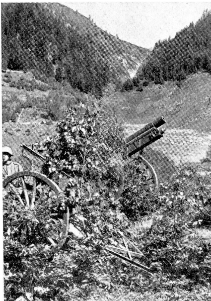
Gut getarntes 7,5-cm-Geschütz in mittlerer Schußelation auf Böcken.

Als am Weihnachtsabend die Nacht vom Luganer See heraufstieg und die Schildwache ihren Posten ver-