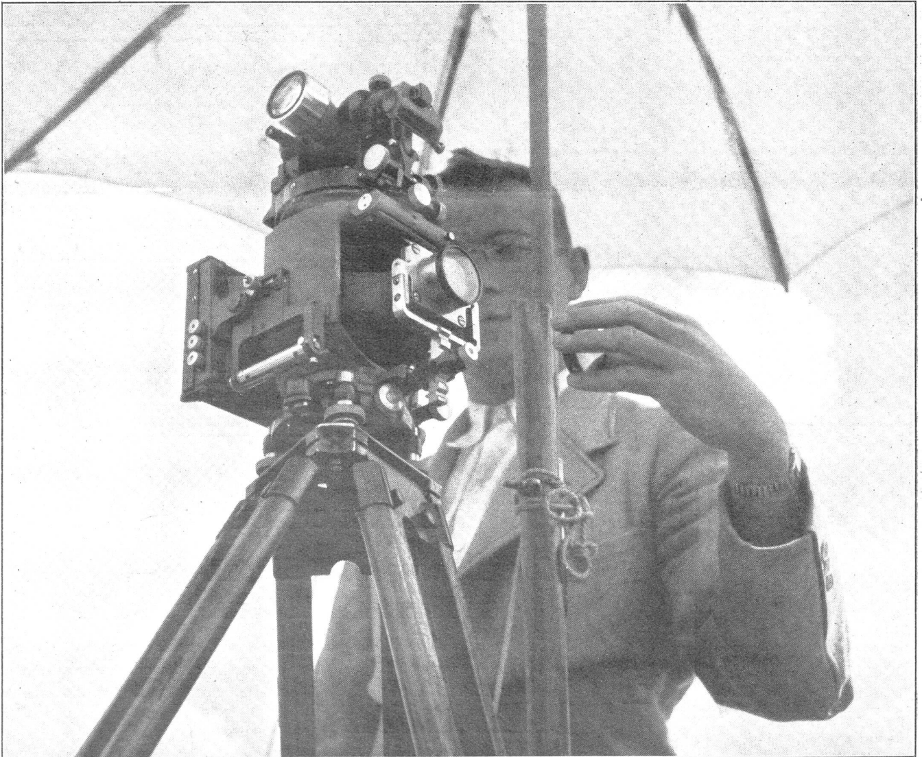
Vom Entstehen unserer Landkarten. Photogrammeter bei der Aufnahme eines Geländeabschnittes; Zeit-Exposition der Aufnahme. Phot. K. Egli, Zürich. Travaux préparatoires pour l'établissement de nos cartes topographiques. Prise de vue photogrammétrique d'un secteur de terrain. Temps d'exposition. Come sorgono le nostre carte geografiche. Fotogrammetrico alla presa fotografica di un settore di terreno. Esposizione a tempo.