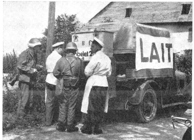
Die Milchwagen der Schweizerischen Milchkommission erfreuen sich bei den Manövern stets eines guten Zuspruches durch die Truppe.

Sicherlich werden alle die obengenannten Punkte in ihrer Gesamtheit den so fabelhaft raschen Sieg bedingt haben. Ich persönlich bin aber davon überzeugt, daß die geistigen und seelischen Kräfte, die im heutigen italieni-