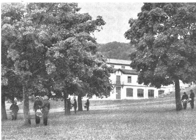
Tambour-Rekruten beim Ueben unter Bäumen verteilt, je ein schwacher und ein guter Tambour zusammen.

werden anfangs auf kurze Distanzen beschränkt, um später weiter ausgedehnt zu werden. Bis zur Zeit der Verlegung müssen alle Tambouren soweit ausgebildet sein, daß jeder einzelne imstande ist, vor einer Kp. zu schlagen, wobei der Tambour das Tempo und die Schrittlänge genau einzuhalten hat. Sichere Kenntnis der Märsche 1—12 und eine präzise Schlagweise in technischer, ganz besonders aber in rhythmischer Hinsicht, sind für den Militärtambour unerlässlich, soll er auf dem Marsch ein nützlicher Helfer sein. Die Schrittlänge von 80 cm ist für den Militärtambour Vorschrift. Man bezweckt damit, unter Berücksichtigung der Infanteristen im Feldmarsch (nicht im Gebirge) eine bestimmte Marschleistung zu erreichen und zu fördern. Während des Ausmarsches werden die Tambouren auf die Kpn. verteilt und ihre Aufgabe ist es nun, zu zeigen, was sie inzwischen gelernt haben. Damit ist aber ihre Ausbildung bei weitem nicht abgeschlossen. In der Verlegung werden alle Tambouren wieder zusammen genommen und