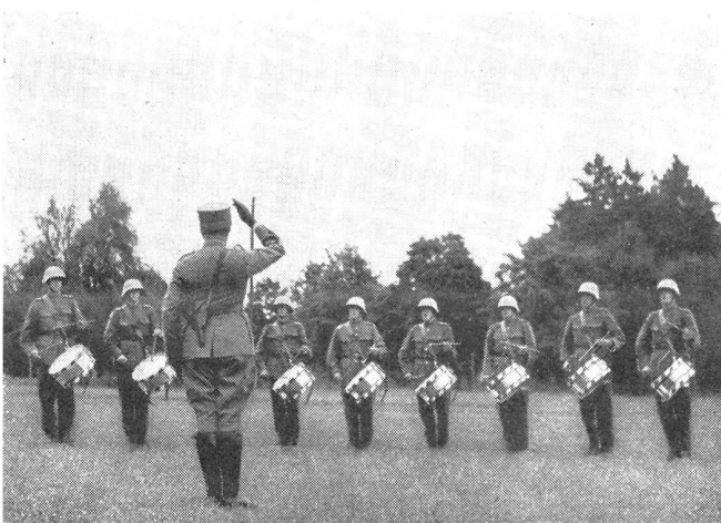
Fachinstruktion durch den Instruktions-Unteroffizier, zu welcher die Tambour-Rekruten im Halbkreis zusammengezogen werden.

(O.G.) Auf das Inkrafttreten der neuen Truppenordnung ist Oberstdivisionär Joh. von Muralt, der Kom-