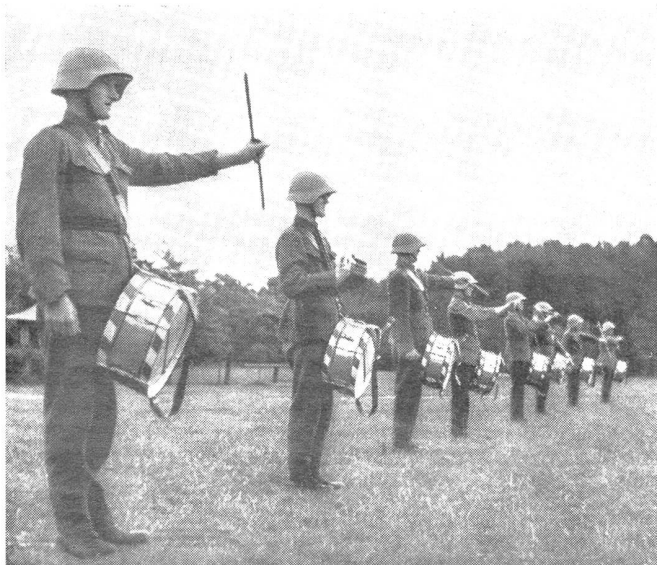
Schlegelübungen, als Vorübung zum Trommeln und zum Lockern des Handgelenkes.

Diese fachliche, außerdienstliche Weiterbildung ist auch deshalb von größter Wichtigkeit, weil im W.K. keine Ausbildung mehr erfolgt. Der Tambour ist hier