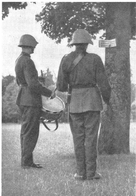
Beim Erlernen der Märsche und Signale nach Noten aus der schweizerischen Tambour-Ordonnanz.

Etude des marches et signaux d'après le recueil d'ordonnance à l'usage des tambours.