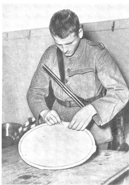
Tambour beim Aufziehen eines neuen Kalbfelles. Eine Arbeit, die einige Übung und vor allem auch Fingerspitzengefühl erfordert.

Die ersten Wochen werden für die Erlernung der Grundlagen, Notenkenntnis, rhythmischen Übungen usw. verwendet, sowie der Märsche und Signale. Dann folgen Marschübungen, und zwar anfänglich ohne, später mit leichter bis voller Packung. Auch diese Marschübungen