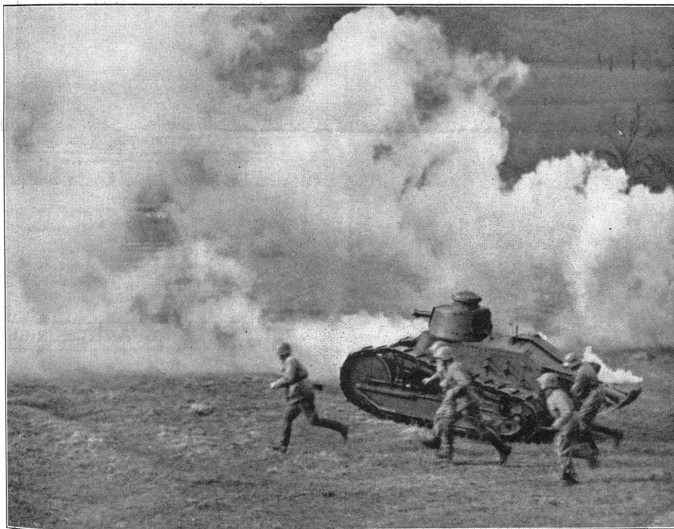
1. Zentralkurs für Handgranatenwerfen 1939 in Wallenstadt. Demonstration eines Stoßtrupp-Angriffes in Begleitung von Kampfwagen. 1er Cours central 1939 pour le lancement de grenades à main, à Wallenstadt. Démonstration d'attaque d'une troupe de choc accompagnée de chars de combat. 1. corso centrale per lancio granate a mano nel 1939, in Wallenstadt. Dimostrazione eseguita da un gruppo d'assalto. Attacco coadiuvato da carri armati.