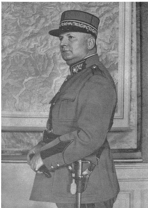
Generalstabchef Oberstkorpskommandant Jakob Labhart

Nach Anhörung des Generals wählte der Bundesrat gemäß Art. 205 der Militärorganisation, den bisherigen