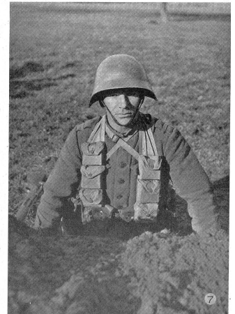
Die Tiefe des Schützenloches ist so zu halten, daß noch freie Be- obachtung und sichere Schußabgabe über die Brustwehr möglich ist. La profondeur du trou de tireur doit être telle qu'elle permette l'observation ainsi qu'un tir précis par dessus le parapet. La profondità della buca per tiratore dev' essere tale da permettere l'osservazione libera e una sicura partenza del colpo sopra il para- petto.