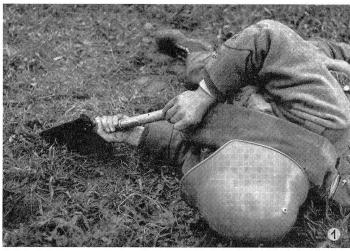
Das Einstecken des Spatens über Eck. La bêche est enfoncée de coin. Come si conficca la pala nel suolo.