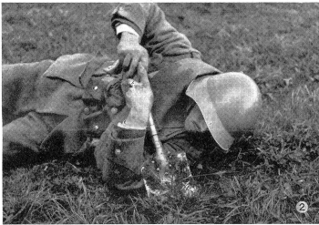
Durch Aufdrehen des Spatenstieles wird Ausnützung des ganzen Spaten- blattes erzielt. Il faut toutefois redresser la bêche pour utiliser toute la surface de l'ailette. Facendo leva sul manico, si utilizza tutta la superficie della pala.