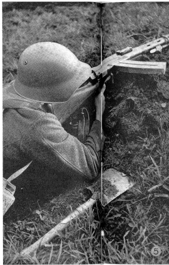
Für die richtige Schußabgabe ist festes Anlehnen der Ellenbogen neben der Schützengrube von großer Wichtigkeit. Pour assurer un bon départ du coup, il est très important que les coudes soient bien appuyés hors de l'excavation. Per conseguire buoni risultati alla partenza del colpo, è oltremodo necessario che i gomiti siano bene appoggiati alla cunetta per tiratore.