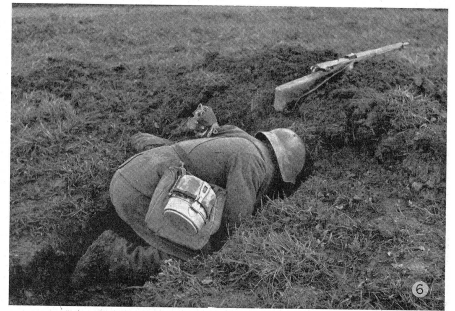
Beginn des Aushubes des Schützenloches aus der Schützengrube heraus. Début de la transformation de l'excavation en «trou de tireur». Inizio dei lavori di scavo per una buca per tiratore, da una cunetta per tiratore.