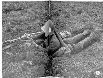
Durch öfteren Anschlag ist die Zweckmäßigkeit der stets höher werdenden Brustwehr als Gehversatz zu kontrollieren. Pour pouvoir tirer commodément, le parapet doit être utilisé comme support de fusil. Il convient de le vérifier souvent pendant le travail de creusement. Man mano che il parapetto si alza, si controllerà se esso può servire da sostegno efficace per il fucile, mettendo più volte l'arma alla spalla.