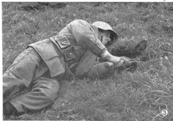
Mit einfachem Hebeldruck läßt sich oft der ringsum abgestochene Rasen- zettel abheben. Souvent, une simple pression sur le manche de la bêche permet d'arracher d'un seul coup la moite de terre préalablement décapée. Non di rado, appoggiando leggermente sul manico dell'attrezzo, si può levare tutta la zolla erbosa tagliata intorno.