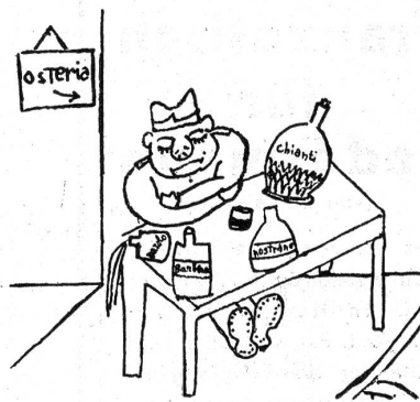
LE BELLE BUGIE: il fuciliere che aveva chiesto un giorno di congedo per recarsi a casa a vendemmiare.

dere te e i tuoi commilitoni, ma state attenti che se vi sento io ve la do io, e sei sempre quel brutto sfacciato, e più ci penso e più mi fa dispiacere. Ma ti perdono lo stesso.