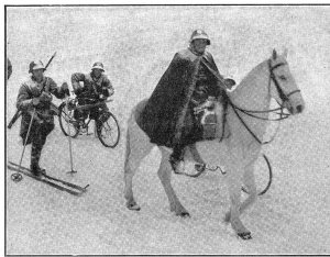
Zensur-Nr. A/0065 Bild Nr. 1. Drei verschiedene Fortbewegungsmittel: Pferd, Ski und Fahrrad. Trois moyens de locomotion différents: le cheval, le ski et la bicyclette. Tre differenti mezzi di locomozione: il cavallo, lo sci e la bicicletta.