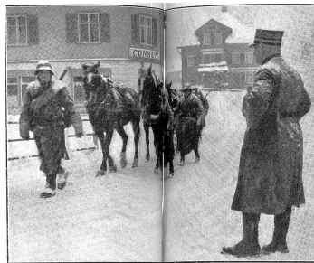
Zensur-Nr. A/0060 Bild Nr. 4. Der Divisionskommandant insiziert die Marschdisziplin einer Artillerie-Kolonnen. Le commandant de division inspekte la discipline de marche d'une colonne d'artillerie. Il comandante di Divisione ispeziona la disciplina di marcia di una colonna di artiglieria.