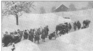
Zensur-Nr. A/0063 Bild Nr. 3. Die leichten I k . vermögen unschwer der Infanterie zu folgen. Grâce à leur légèreté, les can. inf. sont à même de suivre la troupe sans difficulté. Leggero e mobilissimo, il cannone di fanteria accompagna la fanteria in tutte le fasi del combattimento.