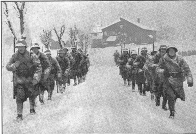
Zensur-Nr. A/0058 Bild Nr. 2. Die geöffnete Zweierkolonne erleichtert den Fußtruppen den Straßennarsch (F.D. Art. 124). La colonne par deux ouverte facilite la marche sur route des troupes à pied. La colonna per due aperta facilita la marcia alle truppe appiedate (S. C. num. 124).