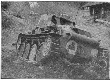
Die Ueberschreitfähigkeit von Gräben ist abhängig von der Länge des Fahrzeuges; sie schwankt zwischen \frac{1}{2} und \frac{3}{4} der Gesamtlänge. (VIB 1360.)

La capacité de franchissement de tranchées est dépendante de la longueur du char; elle varie entre la moitié et le tiers de la longueur totale de ce dernier.