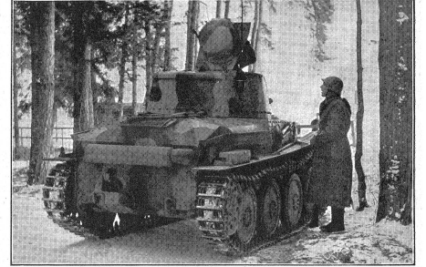
Diese Truppen haben in enger Zusammenarbeit mit den Panzerwagen zu handeln; gegenseitig sind die gemachten Beobachtungen laienförmig auszutauschen. (VIB 1362.)

L'impiego dei carri armati d'esplorazione avviene per nuclei esploranti nella cornice degli organi d'esplorazione moderna che, oltre a reparti di motociclisti, può comprendere anche fanteria motorizzata ed armi pesanti di fanteria.