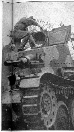
Die Besatzung eines Panzerfahrzeuges bildet eine Kampfgemeinschaft, deren Schicksal vom schicksal und schnellen Handeln des einzelnen abhängt; sie schwankt in der Stärke zwischen 2 bis 6 Mann, je nach Größe des Fahrzeuges. (VIB 1368.)

La possibilità di arrampicare su sponde ripide corrisponde di regola all'altezza dell'asse delle ruote anteriori sopra il terreno. Questo è di circa 1 m per i carri armati leggeri e medi, e di 1,7 m per i carri ultrapesanti.