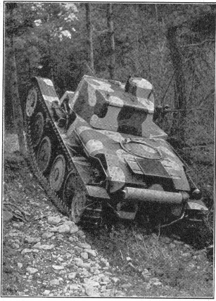
Vermöge ihrer Räderketten erreicht die Steigfähigkeit von Panzerfahrzeugen an Böschungen und Hängen heute allgemein 45 Grad. (Zensur-Nr. VIB 1365.)

Grâce à leurs roues à chaînes, les chars blindés sont capables aujourd'hui de gravir en moyenne des pentes et des talus de 45 degrés.