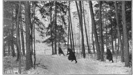
Der Einsatz der Panzer-Aufklärungswagen erfolgt spärlichweise im Rahmen zeitlicher Aufklärungsverbände, denen neben Motorradfahrern auch motorisierte Infanterie und schwere Infanteriewaffen zugeordnet können. (VIB 1363.)

L'equipaggio di un carro armato costituisce una comunità di combattimento il cui destino dipende dall'agire rapido e corretto del singolo; esso ragguaglia un effettivo di 2 a 6 uomini a seconda della mole del carro.