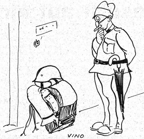
Der zerstreute Professor soll einrücken! „Wäni jetzt nu na wüfsti, für was i die Sach zwäggmacht han?“